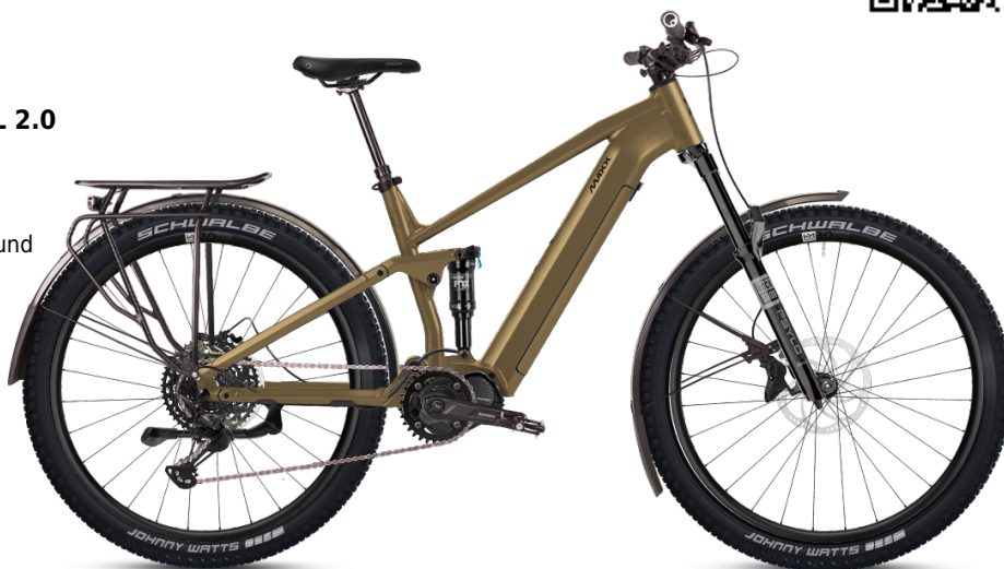
HINWEIS: Abbildungen der Räder sind beispielhaft