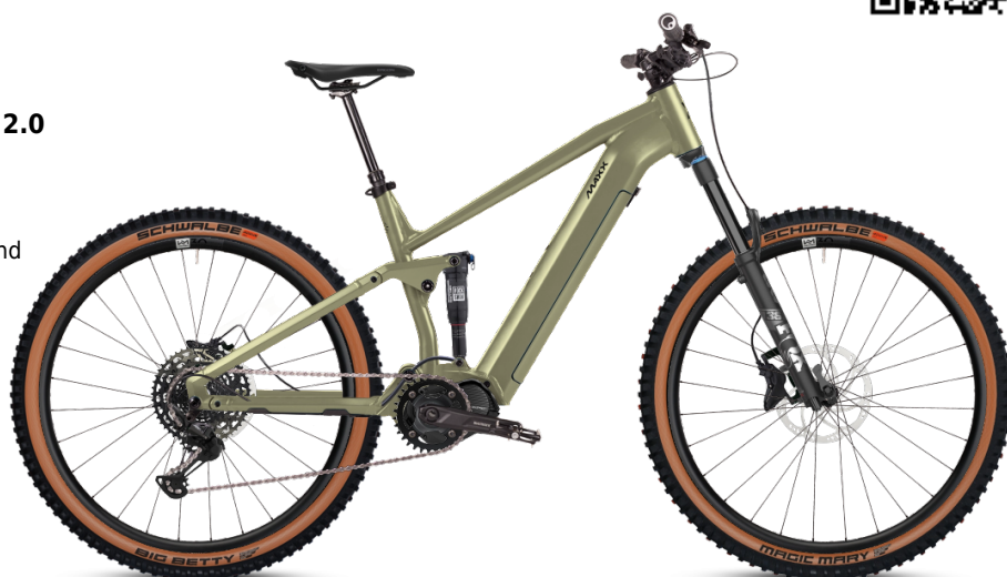
HINWEIS: Abbildungen der Räder sind beispielhaft