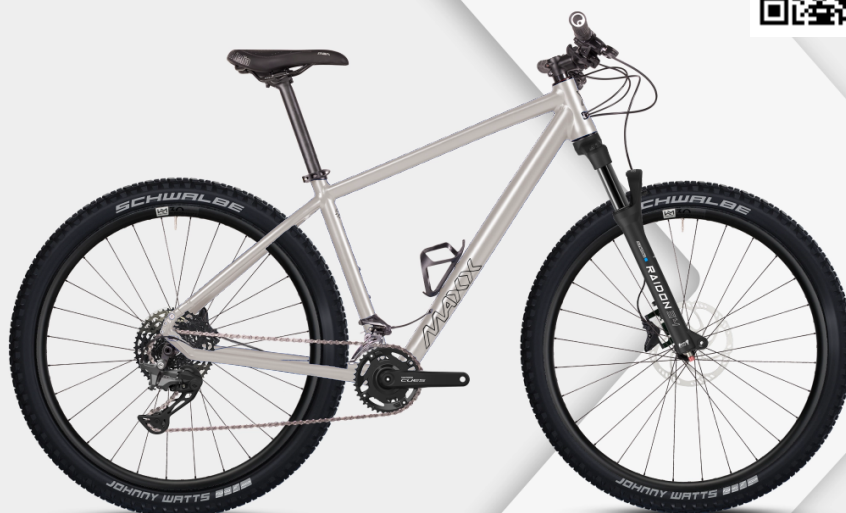
HINWEIS: Abbildungen der Räder sind beispielhaft