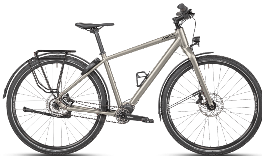
HINWEIS: Abbildungen der Räder sind beispielhaft

Diese Konfiguration wurde bei MAXX abgespeichert und kann mit Klick auf den Code oder unter www.maxx.de/de/service/konfiguration.php aufgerufen und weiter bearbeitet werden.