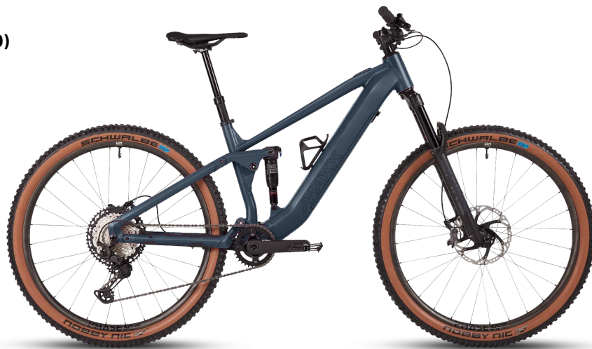
HINWEIS: Abbildungen der Räder sind beispielhaft

Diese Konfiguration wurde bei MAXX abgespeichert und kann mit Klick auf den Code oder unter www.maxx.de/de/service/konfiguration.php aufgerufen und weiter bearbeitet werden.