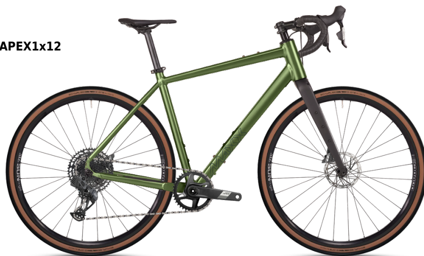
HINWEIS: Abbildungen der Räder sind beispielhaft

Diese Konfiguration wurde bei MAXX abgespeichert und kann mit Klick auf den Code oder unter www.maxx.de/de/service/konfiguration.php aufgerufen und weiter bearbeitet werden.