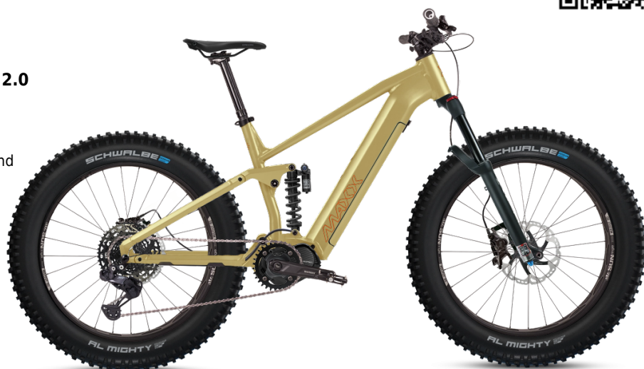
HINWEIS: Abbildungen der Räder sind beispielhaft