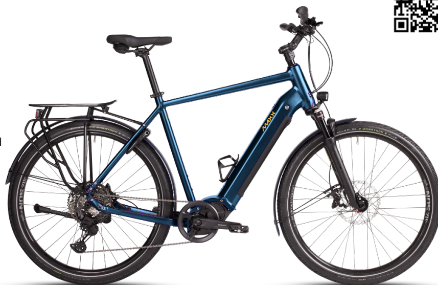
HINWEIS: Abbildungen der Räder sind beispielhaft

Diese Konfiguration wurde bei MAXX abgespeichert und kann mit Klick auf den Code oder unter www.maxx.de/de/service/konfiguration.php aufgerufen und weiter bearbeitet werden.