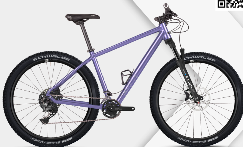
HINWEIS: Abbildungen der Räder sind beispielhaft