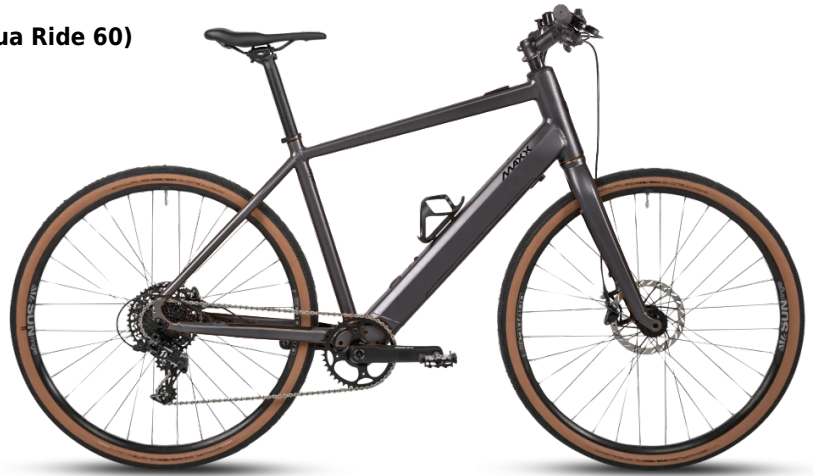
HINWEIS: Abbildungen der Räder sind beispielhaft