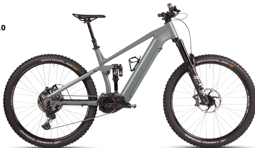
HINWEIS: Abbildungen der Räder sind beispielhaft

Diese Konfiguration wurde bei MAXX abgespeichert und kann mit Klick auf den Code oder unter www.maxx.de/de/service/konfiguration.php aufgerufen und weiter bearbeitet werden.