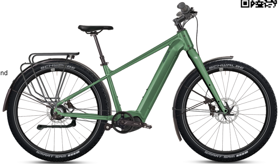
HINWEIS: Abbildungen der Räder sind beispielhaft