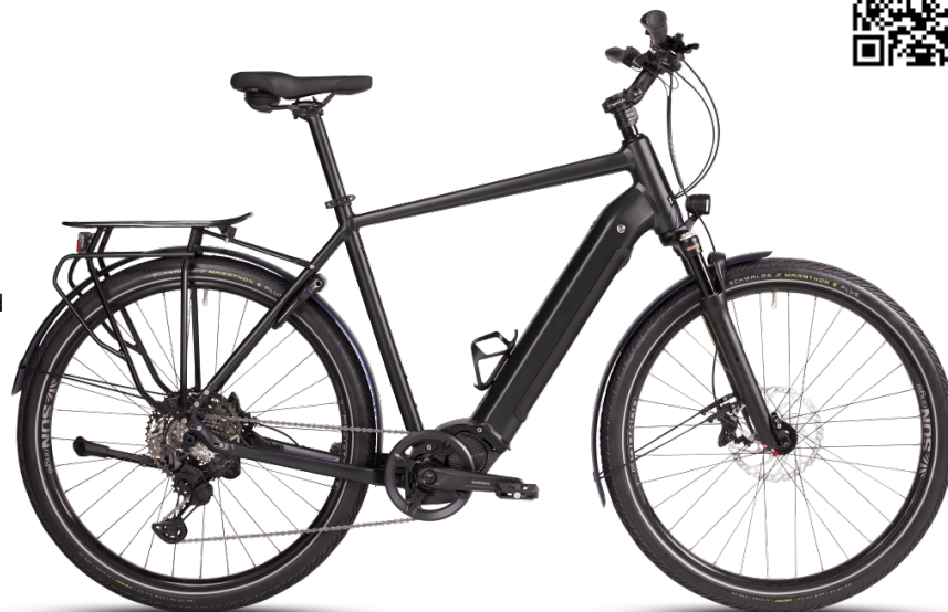
HINWEIS: Abbildungen der Räder sind beispielhaft

Diese Konfiguration wurde bei MAXX abgespeichert und kann mit Klick auf den Code oder unter www.maxx.de/de/service/konfiguration.php aufgerufen und weiter bearbeitet werden.