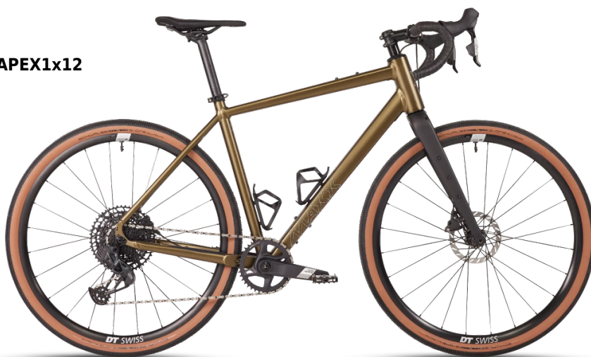
HINWEIS: Abbildungen der Räder sind beispielhaft