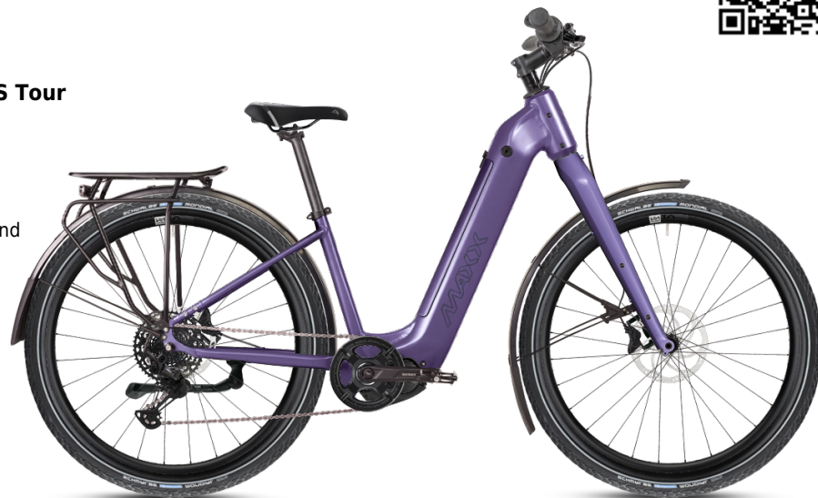
HINWEIS: Abbildungen der Räder sind beispielhaft

Diese Konfiguration wurde bei MAXX abgespeichert und kann mit Klick auf den Code oder unter www.maxx.de/de/service/konfiguration.php aufgerufen und weiter bearbeitet werden.