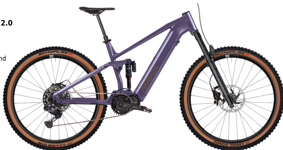
HINWEIS: Abbildungen der Räder sind beispielhaft