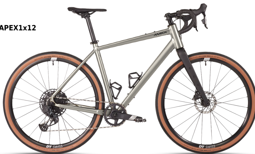
HINWEIS: Abbildungen der Räder sind beispielhaft

Diese Konfiguration wurde bei MAXX abgespeichert und kann mit Klick auf den Code oder unter www.maxx.de/de/service/konfiguration.php aufgerufen und weiter bearbeitet werden.