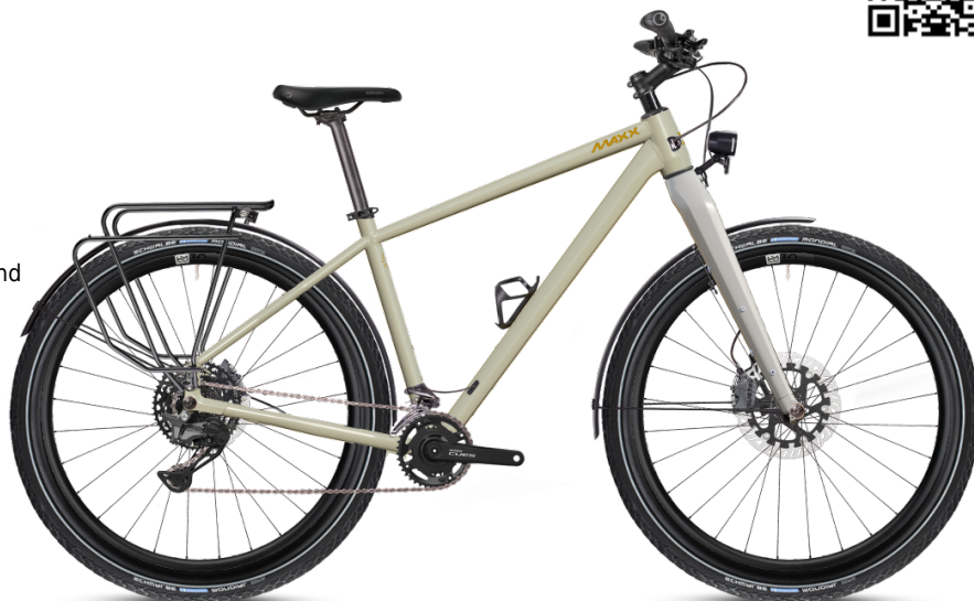
HINWEIS: Abbildungen der Räder sind beispielhaft