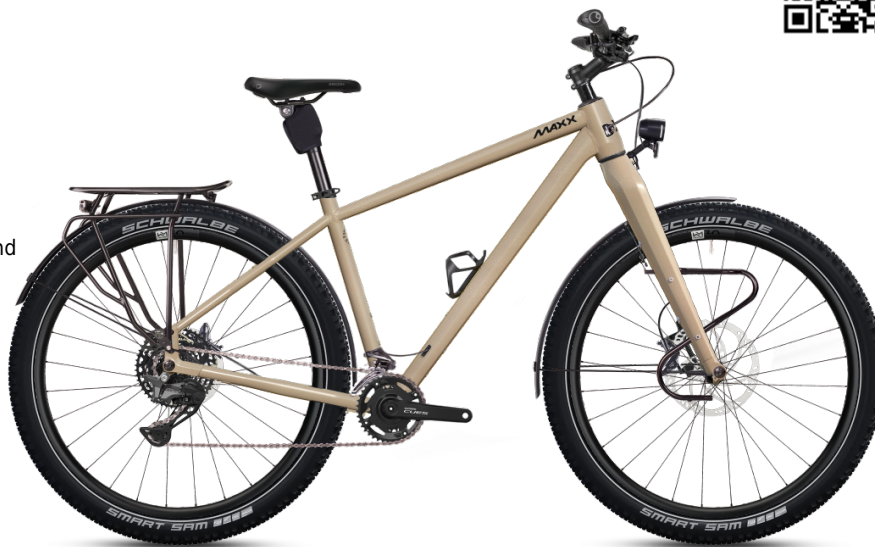
HINWEIS: Abbildungen der Räder sind beispielhaft