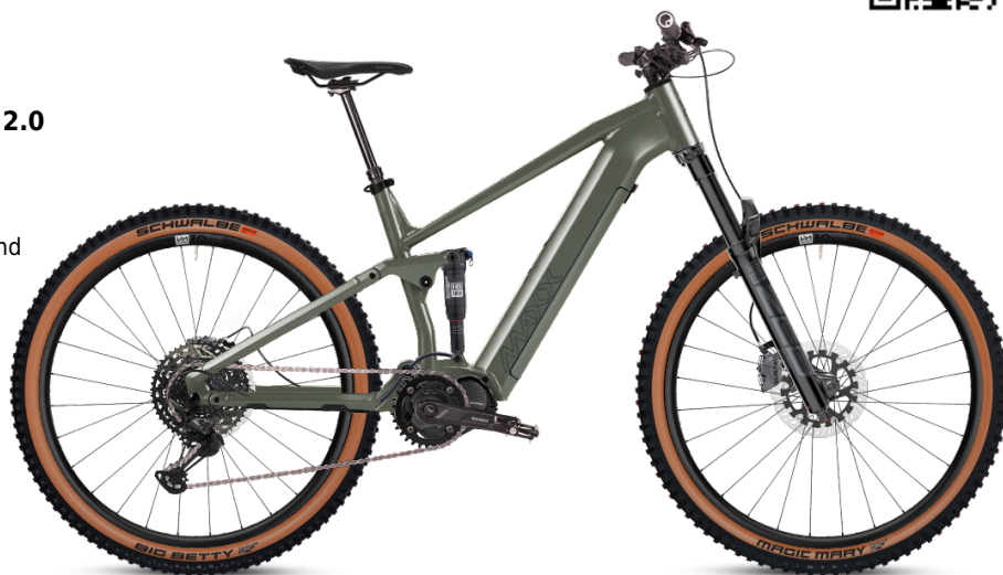
HINWEIS: Abbildungen der Räder sind beispielhaft